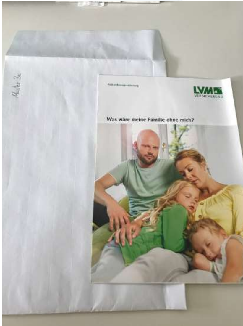
Abbildungen Prüfgegenstand 3b

Berichtigung vom 8.3.2022 (korrigierte Maße der Prüfgegenstände 1 und 2)